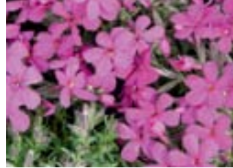
Phlox douglasii 'Crackerjack'