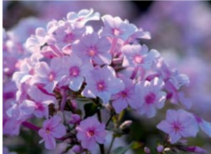
Phlox paniculata 'Lichtspel'