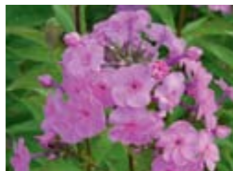
Phlox amplifolia 'Minnehaha'