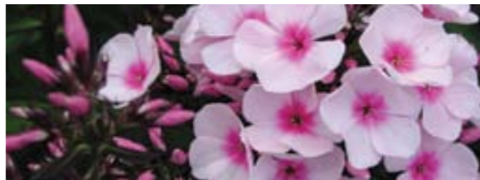
Phlox paniculata 'Bright Eyes'