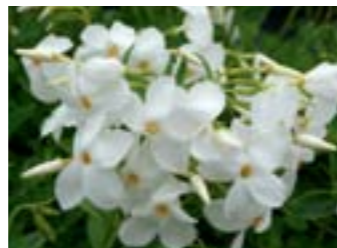
Phlox stolonifera 'Ariane'