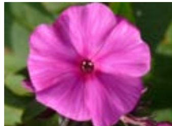
Phlox amplifolia 'Shemeneto'