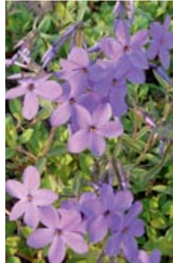
Phlox stolonifera 'Violet Velvet'