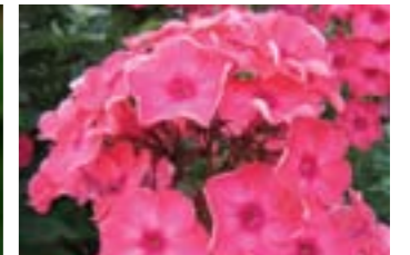
Phlox paniculata 'Redivivus'