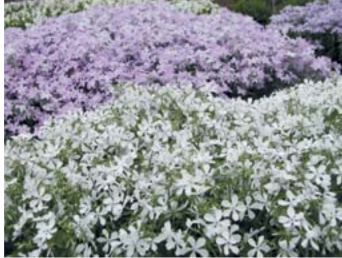
Phlox divaricata 'White Perfume' und 'Clouds of Perfume'