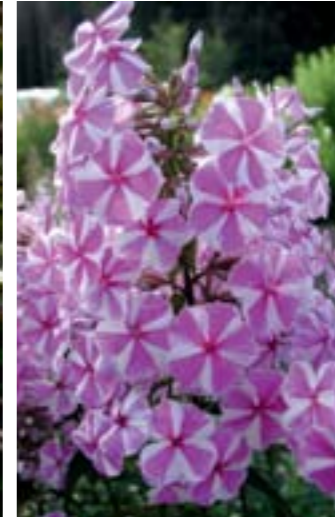
Phlox maculata 'Natascha'