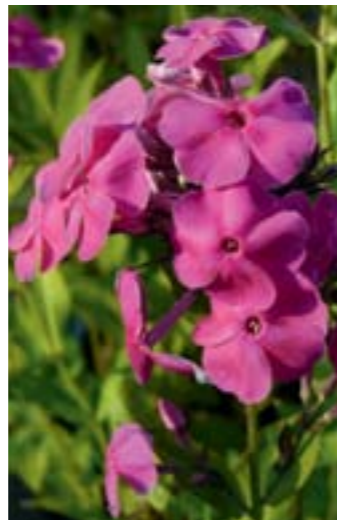
Phlox amplifolia 'Tecumseh'