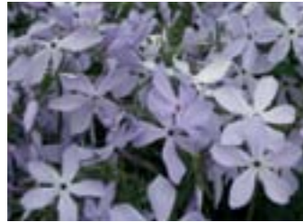
Phlox divaricata 'Clouds of Perfume'