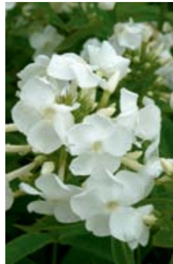
Phlox amplifolia 'David'