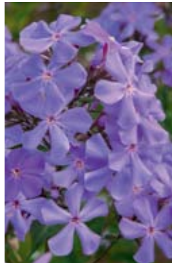
Phlox amplifolia 'Great Smoky Mountains'