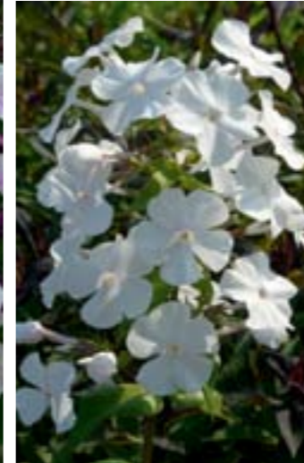
Phlox maculata 'Miss Lingard'