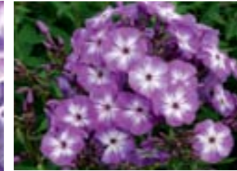
Phlox paniculata 'Laura'