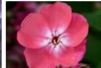
Phlox paniculata 'Capri'