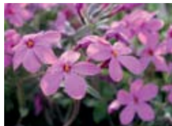
Phlox stolonifera 'Home Fires'