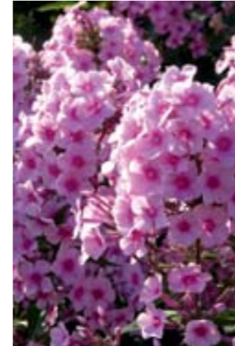
Phlox paniculata 'Miss Pepper'