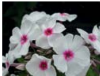
Phlox paniculata 'Graf Zeppelin'