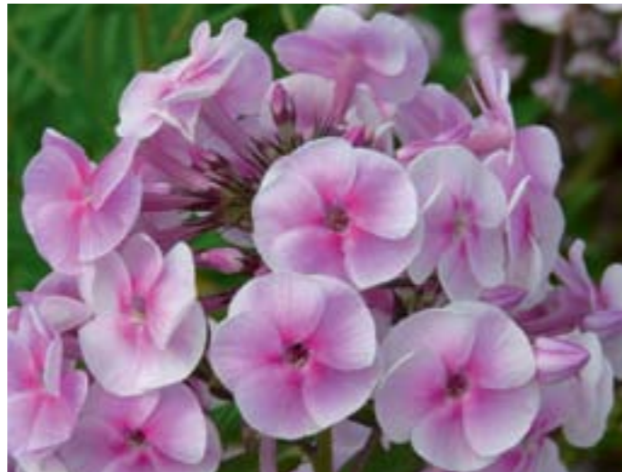
Phlox amplifolia 'Apanatschi'