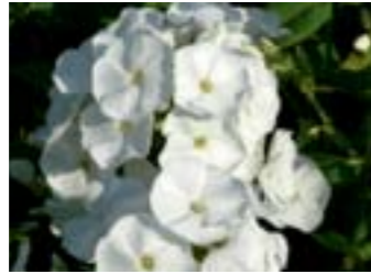
Phlox paniculata 'Pax'