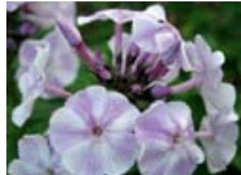
Phlox paniculata 'Prospero'