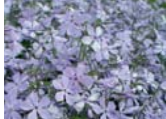
Phlox divaricata ssp. laphamii