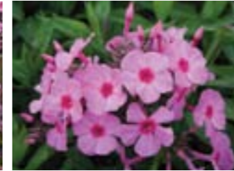
Phlox paniculata 'Dorffreude'