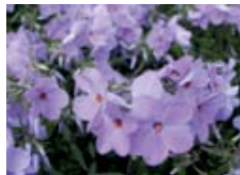
Phlox stolonifera 'Blue Ridge'