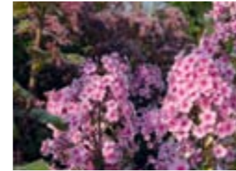
Phlox paniculata 'Miss Pepper'