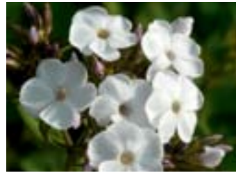
Phlox paniculata 'Chione'