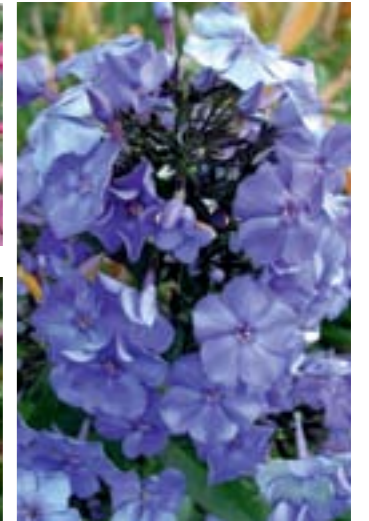
Phlox paniculata 'Blue Paradise'