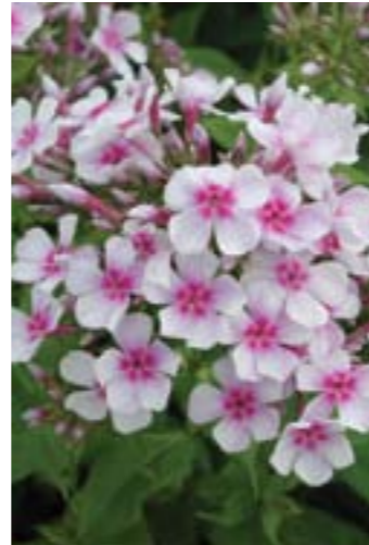
Phlox paniculata 'Wildfang'