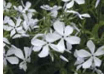
Phlox divaricata 'White Perfume'