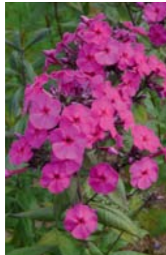
Phlox amplifolia 'Skootekitehi'

amplifolia 'David' strahlend weiß Perenne-Empfehlung / große Blüten gruppieren sich zu imposanten Blütenbällen / naturhaft und wüchsig / sehr gesund, lange Blütezeit / Simon & Mooberry (US) 1978