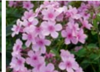
Phlox paniculata 'Marjellchen'