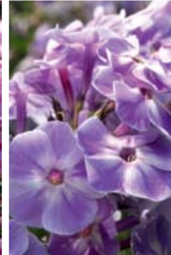
Phlox paniculata 'Violetta Gloriosa'