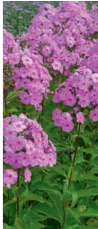
Phlox amplifolia 'Minnehaha'