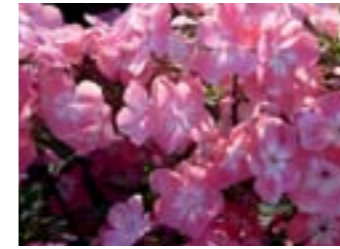
Phlox paniculata 'Eva Foerster'