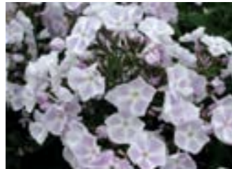
Phlox paniculata 'Prospero'