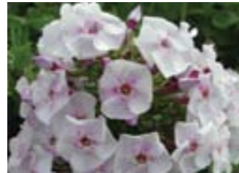
Phlox paniculata 'Pallas Athene'