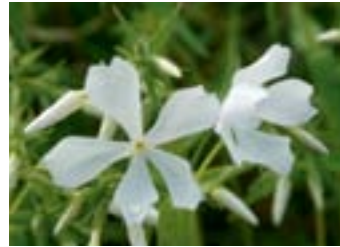
Phlox divaricata 'Fuller's White'