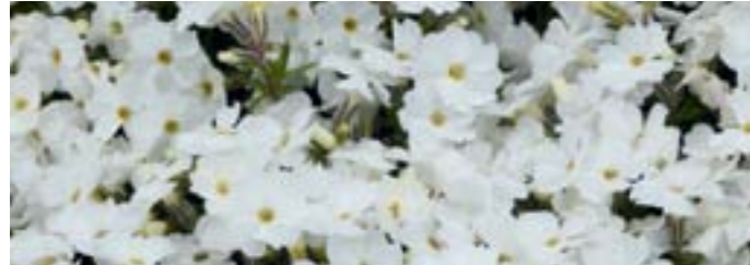
Phlox douglasii 'White Admiral'