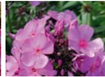
Phlox paniculata 'Judy'