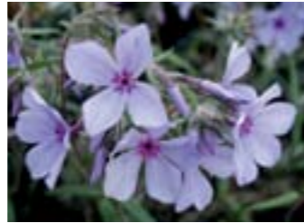
Phlox divaricata 'Chattahoochee'