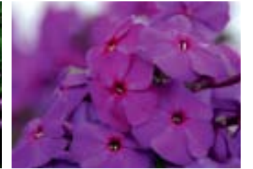
Phlox paniculata 'Düsterlohe'