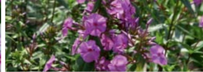
Phlox maculata 'Magnificence'