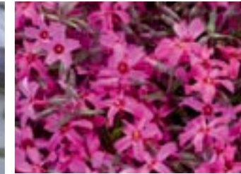
Phlox subulata 'Scarlet Flame'