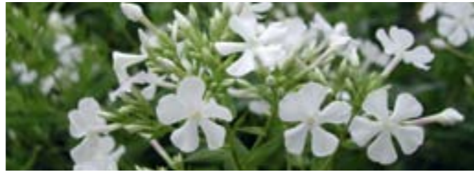
Phlox paniculata 'Casablanca'