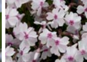
Phlox subulata 'Amazing Grace'