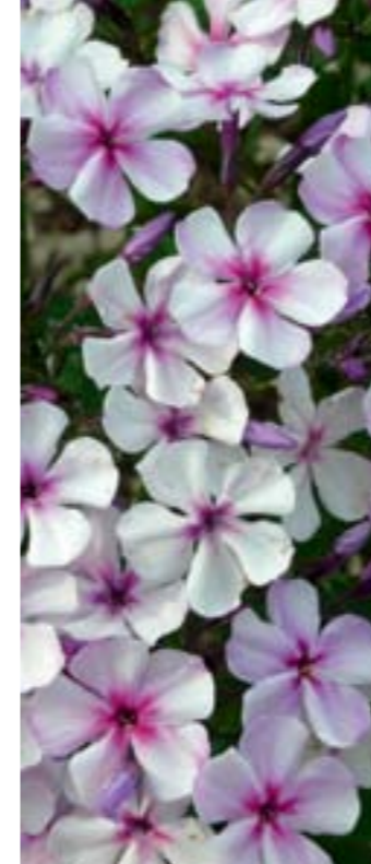
Phlox Arendsii-Hybride 'Susanne'