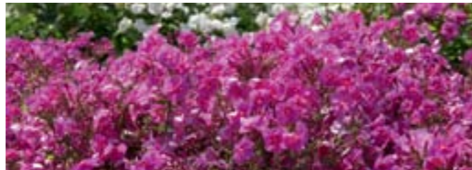
Phlox amplifolia 'Winnetou'