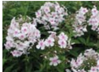
Phlox paniculata 'Kirmesländler'