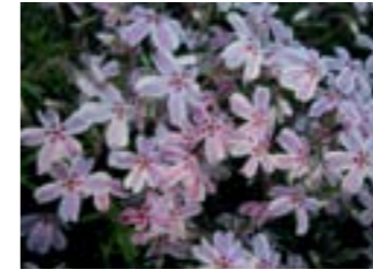
Phlox subulata 'Candy Stripes'