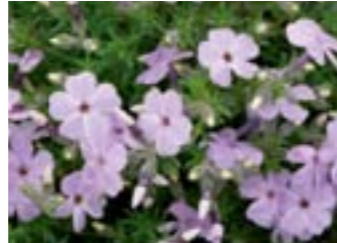
Phlox douglasii 'Lilac Cloud'