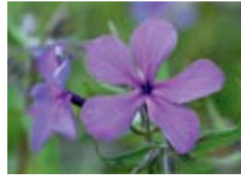
Phlox divaricata 'Eco Texas Purple'