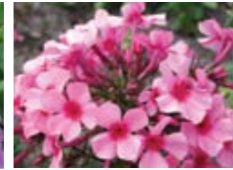
Phlox paniculata 'Argus'