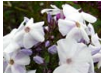
Phlox paniculata 'Schneeraus'