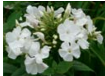
Phlox amplifolia 'Waupee'