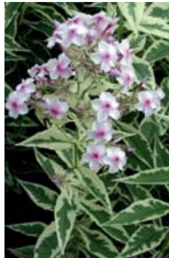
Phlox paniculata 'Nora Leigh'